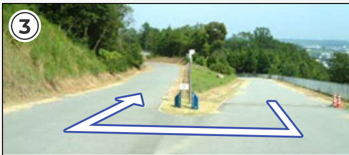
③ 上りきったら180°の急カーブ。