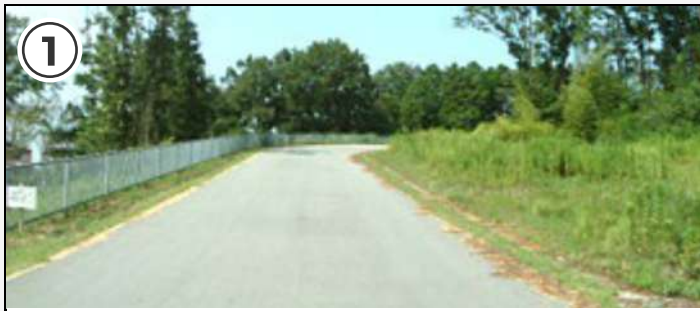
① スタート直後から上り坂。