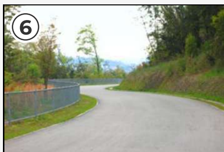
⑥ コース終盤はカーブが多め。