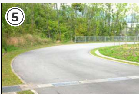
⑤ ここの下り急カーブに注意!